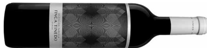
SYRAH FINCA TINEDO SELECCIÓN PARCELA 2018